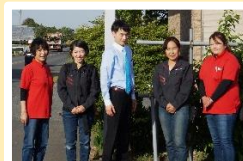
▲気さくなスタッフさん

昭和50年11月に設立され、今年で42年。包装資材の販売店で、スーパーやお弁当屋さん等を中心に幅広くご商売されています。ラップや洗剤等、家庭用品の購入も可能です。これからの時期バーベキューに必須の割り箸や紙コップ、紙皿等も取り扱っていますので、皆さま是非お立ち寄り下さい。赤いTシャツのスタッフさん達が出迎えて下さいます。