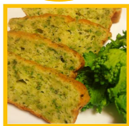
菜の花とチーズの パウンドケーキ