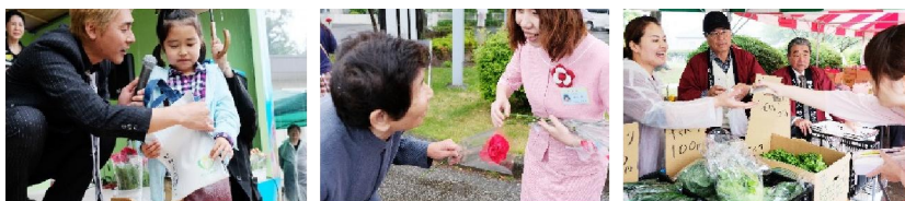
※昨年の好文会祭の様子

平成30年4月28日（土）特定医療法人 好文会 「第9回チャリティー事業 好文会祭」が開催されます。 今年は、今メディアで大人気のANZEN漫才のお2人が 登場予定です★一人でも多くの方にご満足いただけるよう、 精一杯おもてなしさせていただきます。皆様お誘い合わせの上、 ご来場お待ちしております。 ※当日は会場周辺の混雑が予想されますので、お気を付けてご来場 ください。